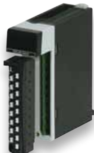
Модули дискретных входов/ выходов